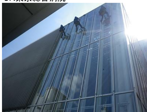
◆東日本旅客鉄道株式会社 様 JR東京総合病院