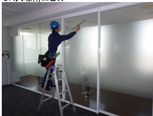
◆JR東日本ビルテック株式会社 様 JR大塚南口ビル