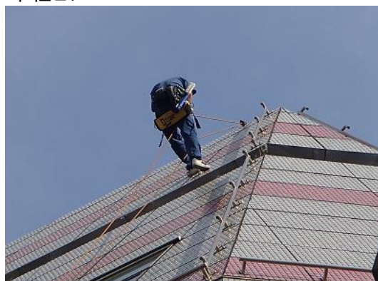
◆株式会社マガジンハウス 様 本社ビル