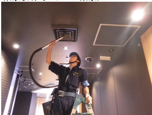
◆株式会社鉄道会館 様 東京駅(グランルーフ東京)